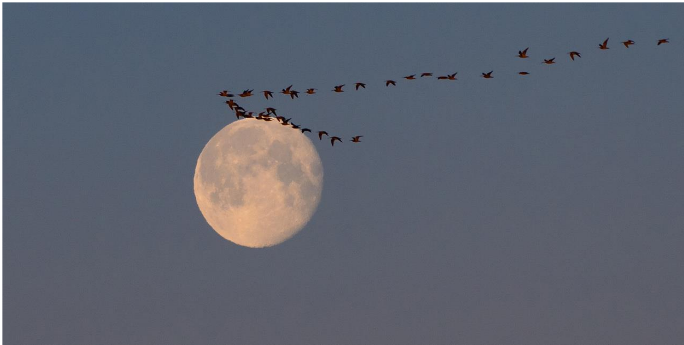
Storspovs mot månen, Uttorp, 2019.

Vi hoppas på sydvind och fint ejdersträck på nära håll. Lovar prognosen mer västlig vind så förlägger vi trippen till Uttorp, Sturkö istället. Vi försöker vara på plats vid 06.00 för att eventuellt få lite storspovs- eller ejdersträck mot månen som håller på att gå ner.