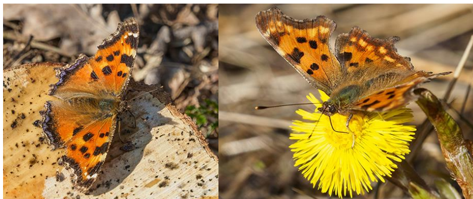
Vide- och vinbärsfuks 2020

Så fort vårsolen och värmen anlant är vårens första fjärilar uppe och flyger. Förra året blev det jackpott med mängder av citronfjärilar, videfuks, körsbärsfuks och sorgmantlar m.m. Även denna tripp kan komma att justeras med plus minus en vecka. Utskick via mail 5-7 dagar innan.