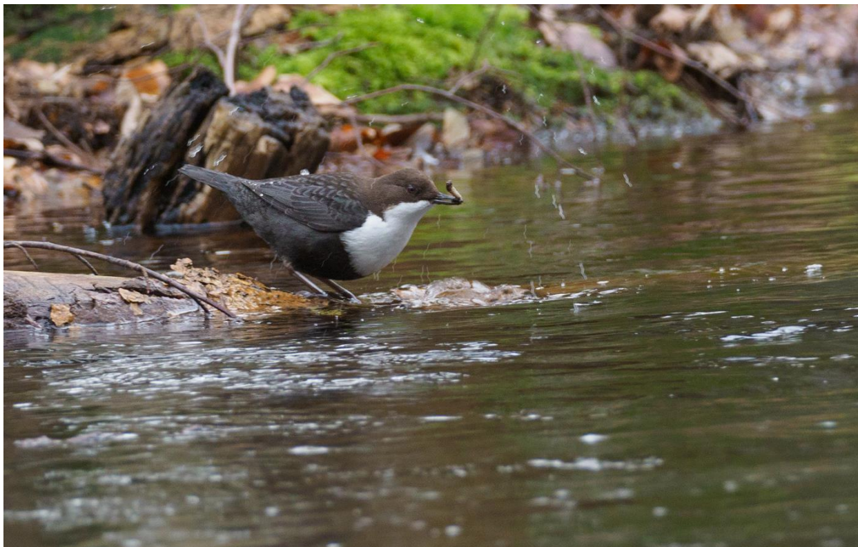
Strömstare med frukost, Lyckebyån 2020.

Vi gör ett nytt försök på strömstararna i Lyckebyån och hoppas på lika fin fotografering som det bjöds på vårvintern 2020. Samling vid Angöringen/Circle K kl. 08.00.